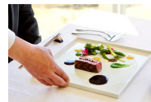
特別コースメニュー（イメージ）