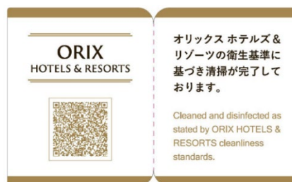
クリーンステイ・ルームシール（イメージ）

クリーンステイ・ルームシールは、客室をガイドラインに基づき清掃・消毒し、それらに加えてお客さまの手などが触れる頻度が高い箇所を専用クリーナーなどで丁寧に拭き上げたことを保証する目印です。客室清掃完了後、ドア部に貼付し、客室の衛生管理状態を確保します。