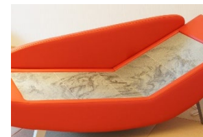
ヒーリングストーンカウチ

※箱根の各ヘリポートから「箱根・芦ノ湖 はなをり」までのタクシー代は別途かかります。