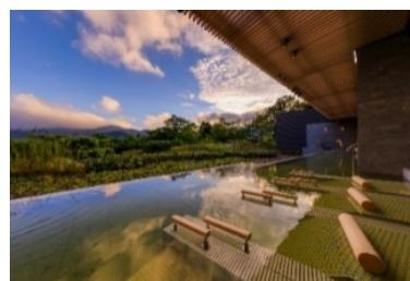
四季の露天風呂棚湯 芦ノ湖ビュー

まるで箱根の森や芦ノ湖とひとつになれるような、ゆったりとしたくつろぎの時間を、お過ごしください。