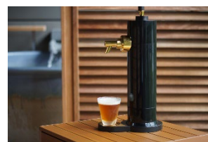
家庭用ビールサーバー

「大切な人と特別な時間を過ごす」をテーマに、移動から滞在まで特別な体験をしていただく、プライベートを確保し快適にお過ごしいただけるご宿泊プランです。