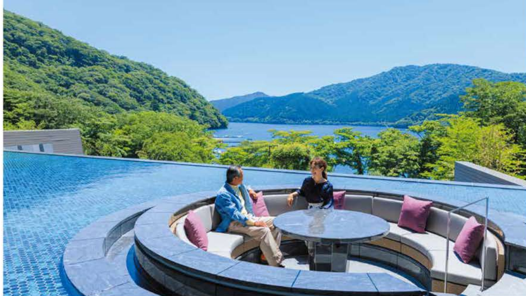
芦ノ湖と一体化したような体験ができる「水盤テラス」は、宿泊者のみが利用できる極上スペース。